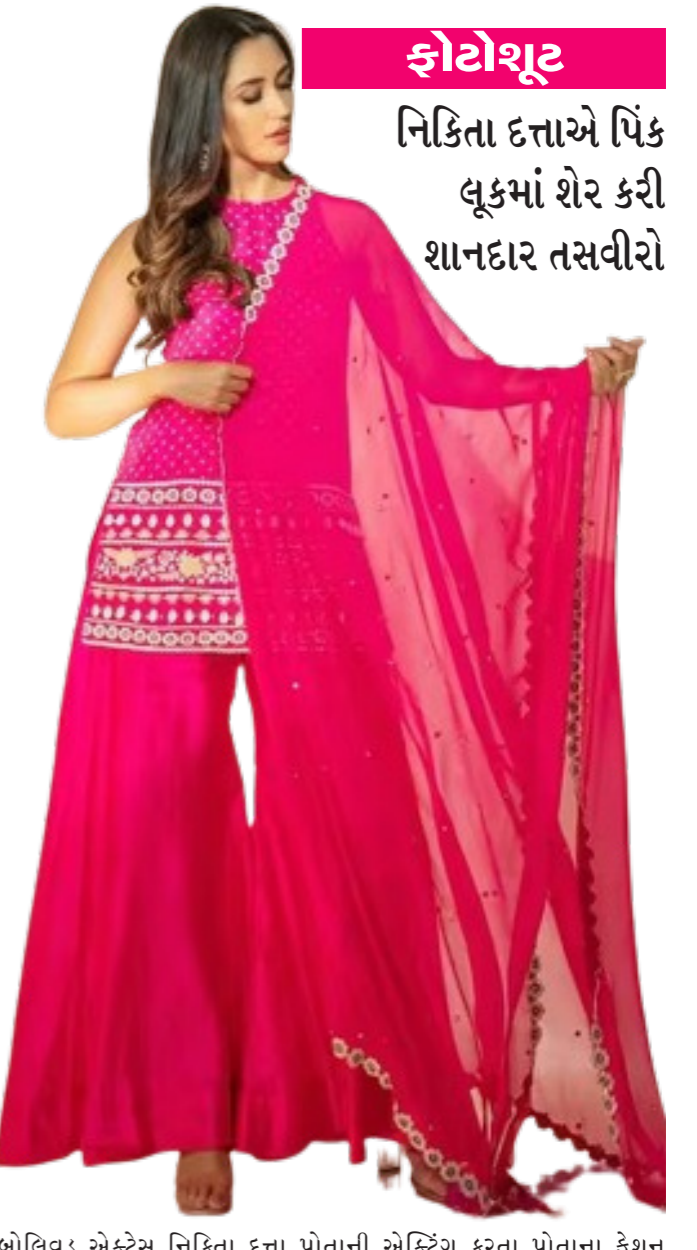
ફોટોશૂટ નિકિતા દત્તાએ પિંક લૂકમાં શેર કરી શાનદાર તસવીરો

મુંબઈ, તા. ૨૬ એટલી એક એવી ફિલ્મ બનાવવા જઈ રહ્યો છે, જેની કોઈએ કલ્પના પણ કરી ન હોય. કેટલાંક વિશ્વસનીય સૂત્રો દ્વારા મળેલી માહિતી અનુસાર એટલી ભારતીય સિનેમાની સૌથી મોટી ફિલ્મ બનાવવા જઈ રહ્યો છે, જેમાં તે ભારતીય સિનેમાના બે સૌથી મોટા સુપર સ્ટાર સલમાન ખાન અને રજનીકાંતને એક સાથે લાવશે. આ જ સૂત્રના જણાવ્યા અનુસાર એટલી સલમાન ખાન અને રજનીકાંત સાથે આવતા મહિને નિર્દેશ કરશે. સૂત્રના જણાવ્યા અનુસાર, 'સન પિક્ચર્સ આ ફિલ્મ પ્રોડ્યુસ કરશે અને તેમને સુપરસ્ટાર રજનીકાંત સાથે પરિવાર જેવા સંબંધો છે. જ્યારે એટલી સલમાન ખાન સાથે છેલ્લા બે વર્ષથી સંપર્ક કર્યા છે. તેમને વિશ્વાસ છે કે રજનીકાંત અને સલમાન ખાન બંને એક સાથે કામ કરવા રાજ થઈ જશે.' હજુ આ ફિલ્મનું કોઈ નામ નક્કી થયું નથી, પરંતુ ૨૦૨૪ના અંત સુધીમાં ફિલ્મનું શૂટિંગ શરૂ થવાની શક્યતા છે. સૂત્રોના જણાવ્યા અનુસાર, 'સલમાન ખાન 'સિક્કદર' પૂરી કરીને પછી એટલીની ફિલ્મનું કામ શરૂ કરશે. જ્યારે સુપરસ્ટાર રજનીકાંત 'ફૂલી'ના ફિલ્મમાં વ્યસ્ત છે. આ ફિલ્મમાં એવું કોમ્બિનેશન બનશે જે વર્ષો સુધી લોકોને યાદ રહેશે.' એટલીએ છેલ્લે શાહરૂખ ખાન સાથે 'જવાન' ફિલ્મ કરી હતી. સલમાન ખાન સાથે એટલીએ બિગ બજેટ ફિલ્મ પ્લાન કરી હોવાનું પાછલા કેટલાક સમયથી સંભળાઈ રહ્યું છે. રિપોર્ટ્સ મુજબ, એટલીએ એક્શન-થ્રિલરથી ભરપૂર ફિલ્મ માટે અગાઉ પુખ્ત સ્ટાર અલ્વુ અર્જુનનો સંપર્ક કર્યો હતો. શરૂઆતમાં અલ્વુએ એટલીની ફિલ્મમાં રસ બતાવ્યો હતો, એટલીએ સલમાન અને રજનીકાંતને સાથે રાખીને બિગ બજેટ ફિલ્મ પ્લાન કરી છે. આ ફિલ્મને સન પિક્ચર્સ પ્રોડ્યુસ કરી રહ્યું હોવાથી બજેટની મર્યાદા નડવાની નથી. પ્રભાસ-અમિતાભ બચ્ચનની 'કલિક' કરતાં પણ વધારે ભવ્ય ફિલ્મ બનાવવાનો પ્લાન છે.