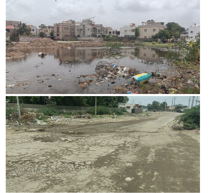
શહેર ના વિવિધ રસ્તાઓ ધોવાઈ ગયા છે.કચ્છના પેરિસ તરીકે ઓળખાતા વિકાસ શીલ મુન્દ્રા શહેર ની પ્રથમ વરસાદ એ પોલ ખોલી દીધી હોય તેમ પાણી તો ભરાયા પરંતુ હજુ પણ કેટલાક વિસ્તારોમાં પાણી ઓસર્વા નથી જેને કારણે સ્થાનીકોમાં રોષ ફેલાયો છે.

મુન્દ્રા, તા.૮ મુન્દ્રા તાજેતર માં છ ઈંચથી વધુ વરસાદ પડતા શહેરની વિવિધ સોસાયટી વિસ્તારોમાં પાણી ભરાયા છે અને વરસાદ થી શહેરના તેમજ આજુબાજુ વિસ્તારના રસ્તાઓ ભિસ્માર બન્યા છે. ત્યારે થોડા સમય પહેલાં પાણીભર્યા ભારે વરસાદ થી વલ્લભકુપા તેમજ તેમની પાછળના સોસાયટી વિસ્તારોમાં હજુ પણ પાણી ભરાયેલા છે અને પાણીમાં પડેલા કચરાથી મચ્છરોનો ઉપદ્રવ વધ્યો છે ત્યારે સ્થાનિક વહીવટી તંત્ર એ નગરમાં જ્યાં જ્યાં વરસાદી પાણી ભરાયા છે તે અનેક સોસાયટી ઓમાં પાણીનો નિકાલ કરી દવાનો છંટકાવ કરે તેવી માંગ ઉઠી છે. થોડા દિવસ પહેલા પડેલા વરસાદ બાદ શહેર નો ઝાક બંગલા થી ન્યુ મુન્દ્રા