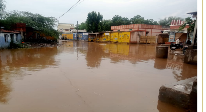
અનેક જગ્યાએ ભારે વિજળી

ભુજ, તા. ૧૮ થોડા દિવસોથી કચ્છમાં વરસાદ સંતાકુકડી રમી રહ્યો છે ભારે ગરમી વચ્ચે કચ્છના લોકો વરસાદની રાહ જોઈ રહ્યા છે પરંતુ વરસાદ જોઈએ તેવો પડતો નથી તેવામાં ગુરૂવારે કચ્છમાં છુટછવાયો વરસાદ પડ્યો હતો. લખપત, અબાડાસા, ભુજ, નખત્રાણા સહિતના વિસ્તારમાં વરસાદ પડ્યો હતો પરંતુ જોઈએ તેવો વરસાદ ન પડતા હજુ પણ અસહ્ય ગરમીનો અનુભવ લોકો કરી રહ્યા છે. ગુરૂવારે બપોરથી સમગ્ર કચ્છમાં અસહ્ય ગરમી વચ્ચે ભારે ગાજવીજ થઈ હતી પરંતુ વરસાદ પડ્યો ન હતો અને છુટછવાયા વરસાદને કારણે રસ્તા ભીના થયા હતા લખપત તાલુકામાં હજુ સુધી મેથરાજા મન મુકીને વરસ્યા નથી તેમ છતાં કેટલાક દિવસોથી પડી રહેલ ઝાપટાઓ રૂપી એકાદ ઈંચ વરસાદના કારણે પશુપાલકો અને માલધારીઓ પુશાખશાલ છે. વાવણી લાયક પહેલા વરસાદને લઈ ખેડૂતોએ વાવણી કાર્ય શરૂ કરી દીધું છે, ધોધમાર વરસાદના અભાવે ૩મો કે તળાવોમાં પાણી આવ્યા નથી. આજે દયાપરમાં અડધો ઈંચ વરસાદ પડી જતાં રસ્તાઓ ઉપર પાણી વહી નિકળ્યા હતા, તાલુકાના દોલતપર, નરડા, સિયોત, પીપર, નવાનગર, બાલાપર, કોટડા-ભાદ, આશાપર ઢગરે મોટા ભાગના ગામોમાં અડધાથી એક ઈંચ વરસાદ પડતાં લોકોમાં પુશી જોવા મળી હતી, બપોર સુધીમાં મોસમનો કુલ વરસાદ ૯૪ મી.મી. જેટલો કન્ટ્રોલરૂમમાં નોંધાયો હતો. તો બીજી તરફ અબાડાસાના અનેક ગામ તથા મુખ્ય મથકમાં વરસાદને કારણે લોકોએ રાહત અનુભવી હતી. પરંતુ જોઈએ તેટલો વરસાદ પડ્યો ન હતો.