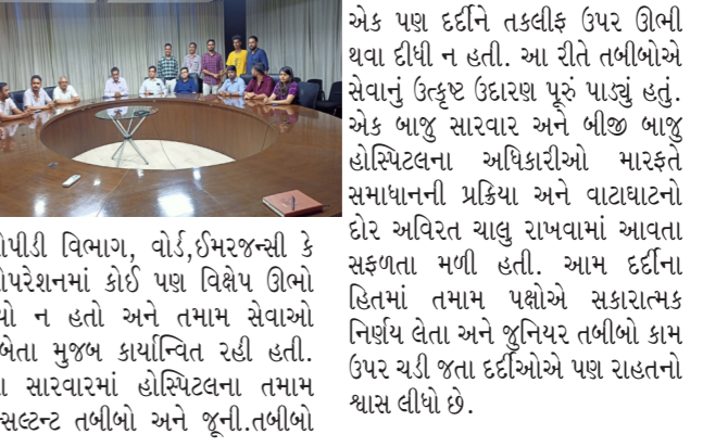
ઓપીડી વિભાગ, વોર્ડ, ઈમરજન્સી કે ઓપરેશનમાં કોઈ પણ વિષેય ઊભો થયો ન હતો અને તમામ સેવાઓ રાહેતા મુજબ કાર્યાન્વિત રહી હતી. આ સારવારમાં હોસ્પિટલના તમામ કન્સલ્ટન્ટ તબીબો અને જૂની તબીબો

ભુજ, તા. ૧૮ જી.કે. જનરલ અદાણી હોસ્પિટલમાં બે દિવસ પહેલા સર્જિલી ઘટનાને પગલે ઊભી થયેલી પરિસ્થિતિને થાળે પાડવા હોસ્પિટલના સત્તાવાળાઓને સફળતા મળી છે અને જુનિયર તબીબોએ હડતાલ પાછી ખેંચી લીધી છે તો બીજી તરફ સંબંધિત વ્યક્તિએ પોતાની ભૂલ સ્વીકારી ભમા પગ માંગી લેતાં સમગ્ર બાબતનો સુપહ એંત આવી ગયો છે. ગૌરેશ મેનેજમેન્ટ, સમાજના આગેવાનો તેમજ જુનિયર ડોક્ટર્સના પ્રતિનિધિઓએ સાથે મળી દર્દીઓની સેવાના વિશાળ હિતમાં પરસ્પર સમાધાનનો નિર્ણય કર્યો છે અને સંબંધિત વ્યક્તિએ પણ આવી બાબતનું પુનરાવર્તન નહીં થાય તેની પણ ખાતરી આપતા સમગ્ર ઘટનાનો સુમેળવ્યા એંત આવ્યો હતો. હોસ્પિટલ ના સત્તાવાળાઓના જણાવ્યા અનુસાર, સારવાર લેતા દર્દીઓએ અગાઉથી જ સારવાર પ્રયત્નો સંતોષ વ્યક્ત કર્યો હતો અને તેમની સારવાર ચાલુ જ હતી. તેમજ તેમને કોઈ તકલીફ ન હોવાનું પણ જણાવ્યું હતું. પરંતુ, અન્ય વ્યક્તિના હસ્તેલેપન કારણે આ ઘટના સર્જઈ હતી. દરમિયાન આ બનાવ પછી પણ જી.કે. માં સારવાર લેવા આવનારો સિવાયના ડોક્ટર્સ જોવાયા હતા અને એક પણ દર્દીને તકલીફ ઉપર ઊભી થવા દીધી ન હતી. આ રીતે તબીબોએ સેવાનું ઉત્કૃષ્ટ ઉદારણ પૂરું પાડ્યું હતું. એક બાજુ સારવાર અને બીજી બાજુ હોસ્પિટલના અધિકારીઓ મારફતે સમાધાનની પ્રક્રિયા અને વાટાઘાટનો ઘેર અવિરત ચાલુ રાખવામાં આવતા સફળતા મળી હતી. આમ દર્દીના હિતમાં તમામ પક્ષોએ સકારાત્મક નિર્ણય લેતા અને જુનિયર તબીબો કામ ઉપર ચડી જતા દર્દીઓએ પણ રાહતનો શ્વાસ લીધો છે.