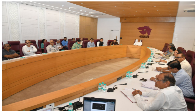
અટકાયત માટે મેલેરિયન પાવડર દ્વારા ડિસ્ટ્રીક્ટ માટેની ડ્રાઈવ હાથ ધરવા તેમજ કોઈ પણ તાવના કિસ્સામાં તાત્કાલિક સહન સારવાર અપાય તે બાબત સુનિશ્ચિત કરવા બેઠકમાં માર્ગદર્શન આપ્યું હતું.