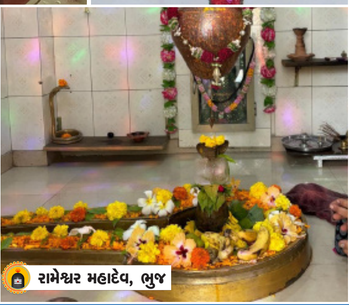
રામેશ્વર મહાદેવ, ભુજ

કરાવો તમારા વિસ્તારના શિવાલયોના દર્શન પ્રવિત્ર શ્રાવણ માસનો પ્રારંભ થઈ ચુક્યો છે. અને સમગ્ર દેશમાં શિવાલયો સાથે ભગવાન શિવના પૌરાણીક મંદિરોના દર્શન માટે ભક્તો ઉમટી રહ્યા છે ત્યારે ન્યુમરકલ્પના માધ્યમથી આ વર્ષે પણ પ્રવિત્ર શ્રાવણ માસ દરમિયાન કચ્છના પ્રસિદ્ધ શિવમંદિરોના દર્શન તમે રોજ કરી શકશો આ સાથે તમારી આસપાસ આવેલા શિવમંદિરોનો મહિમા અને તેના ફોટો પણ તમે અમારા માધ્યમમાં ૯૬૮૭૬૦૫૫૦૯ નંબર પર મોકલી શકો છો. અમે તમારા શિવમંદિરને શિવભક્તો સુધી પહોંચાડશું