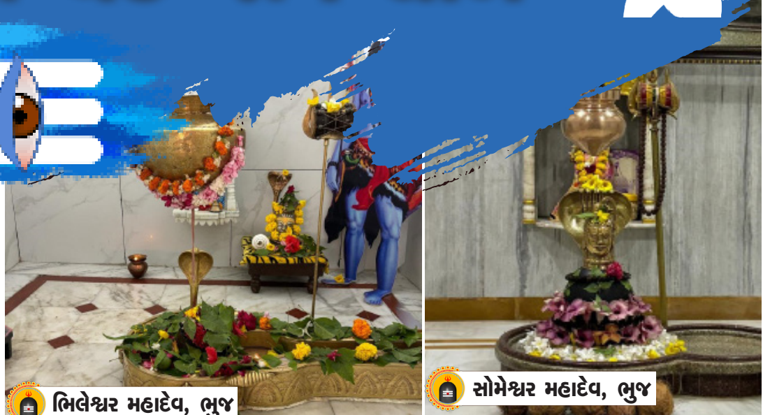
મિલેશ્વર મહાદેવ, ભુજ