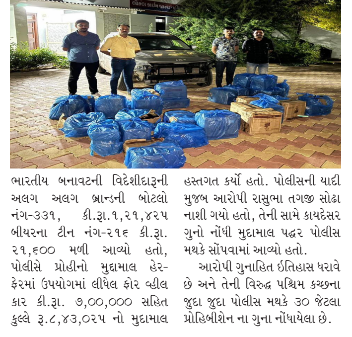
ભારતીય બનાવટની વિદેશીદારૂની અલગ અલગ બ્રાન્ડની બોટલો નંગ-૩૩૧, કી.રૂ.૧,૨૧,૪૨૫ બીયરના ટીન નંગ-૨૧૬ કી.રૂ. ૨૧,૬૦૦ મળી આવ્યો હતો, પોલીસે પ્રોહીતો મુદ્દામાલ હેર-ફેરમાં ઉપયોગમાં લીધેલ ફોર વ્હીલ કાર કી.રૂ. ૭,૦૦,૦૦૦ સહિત કુલ રૂ.૮,૪૩,૦૨૫ નો મુદ્દામાલ