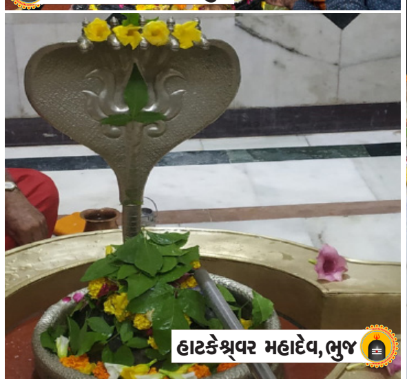
હાટકેશ્વર મહાદેવ, ભુજ