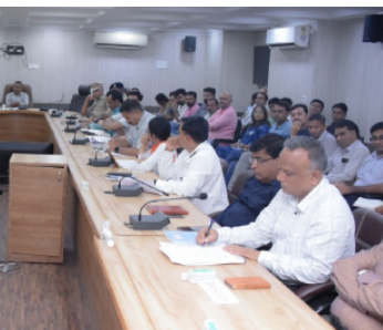
હર ઘર તિરંગા કાર્યક્રમ અંતર્ગત નિવાસી અધિક કલેક્ટરની અધ્યક્ષતામાં ભુજમાં બેઠક યોજાઈ

મુજ તા. ૧૦ કચ્છ જિલ્લામાં ૧૩ ઓગસ્ટ સુધી "હર ઘર તિરંગા" અભિયાન અંતર્ગત "તિરંગા યાત્રા" ના વિવિધ કાર્યક્રમો સાથે કચ્છમાં જિલ્લાકક્ષાની વિશાળ તિરંગા યાત્રાનું ભુજ શહેરમાં આયોજન કરવામાં આવ્યું છે.