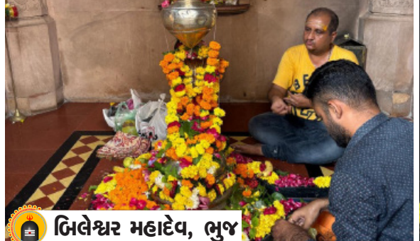
મિલેશ્વર મહાદેવ, ભુજ