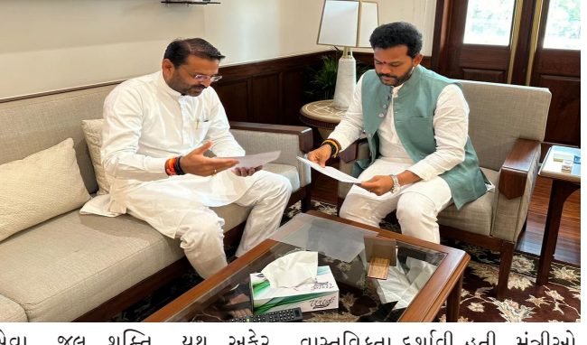
સેવા, જલ શક્તિ, યુથ અફેર અને સ્પોર્ટ મંત્રીઓ ને રૂબરૂ મળી વાસ્તવિકતા દર્શાવી હતી. મંત્રીઓ એ સારા પ્રતીભાવ સાથે હકારાત્મક

કચ્છના સાંસદ તાજેતરમાંજ કચ્છના મહત્વના પ્રશ્નોને લઈને વિવિધ વિભાગોના મંત્રીઓને દિલ્હીમાં રજૂઆત કરી છે ત્યારે કચ્છના વિકાસમાં સહાયરૂપ એવી સેવાઓ કચ્છમાં વિસ્તરે તે માટે કચ્છના સાંસદે રજૂઆત કરી છે. જેમાં દક્ષિણ ભારત ને જોડતી વિમાની સેવા, લુજ થી દિલ્હી સીધી વિમાની સેવા, કંડલા થી મુંબઈ સીધી વિમાની સેવા માટે નાગર મંત્રી કિજરાપુ નાયડુને તથા, ભુજમાં પ્રદેશ રાષ્ટ્રીય કક્ષાનું રમત ગમત ઈન્ડોર મલ્ટીપરપઝ સ્પોર્ટ માટે સ્ટેડિયમ અર્થે યુથ અફેર એન્ડ સ્પોર્ટ મંત્રી મનસુખ માંડવિયાને રજૂઆત કરી છે. જે કે સૌથી મહત્વની રજૂઆત એ રહી હતી કે કચ્છના રણમાં ખારા પાણીમાં સમાઈ જતા મીઠા પાણીના સંગ્રહ માટે રણ સરોવરના નિર્માણ માટે જલ શક્તિ મંત્રી સી.આર. પાટીલને રજૂઆત કરી છે. મુલાકાત બાદ સાંસદે વિસ્તારથી જણાવ્યું હતું કે ભારત સરકારના વિમાની