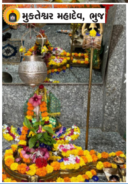
મુક્તેશ્વર મહાદેવ, ભુજ