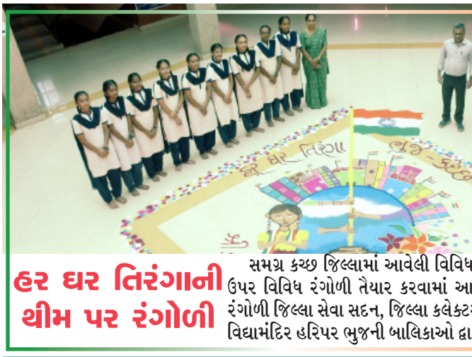
હર ઘર તિરંગાની થીમ પર રંગોળી