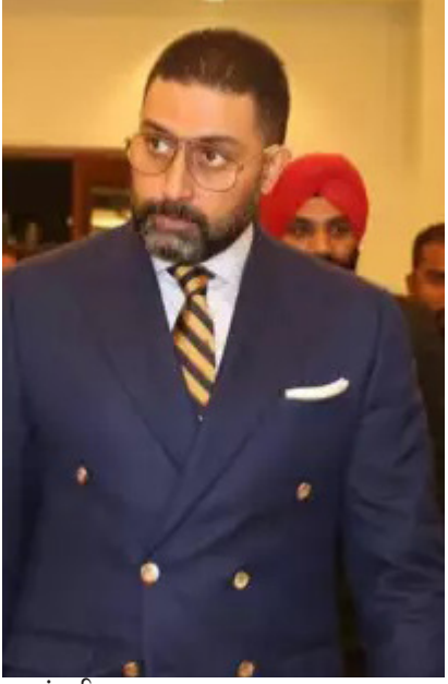
મુંબઈ, તા. ૧૨ અભિષેકની પહેલી ફિલ્મ ફ્લોપ રહી હોવા છતાં તેણે ધીરે ધીરે ઈન્ડસ્ટ્રીમાં પોતાની જગ્યા બનાવી લીધી. પરંતુ શું તમે જાણો છો કે અભિષેકનું ડેબ્યૂ 'ભાગ મિલ્યા ભાગ'

અભિષેકની પહેલી ફિલ્મ ફ્લોપ રહી હોવા છતાં તેણે ધીરે ધીરે ઈન્ડસ્ટ્રીમાં પોતાની જગ્યા બનાવી લીધી