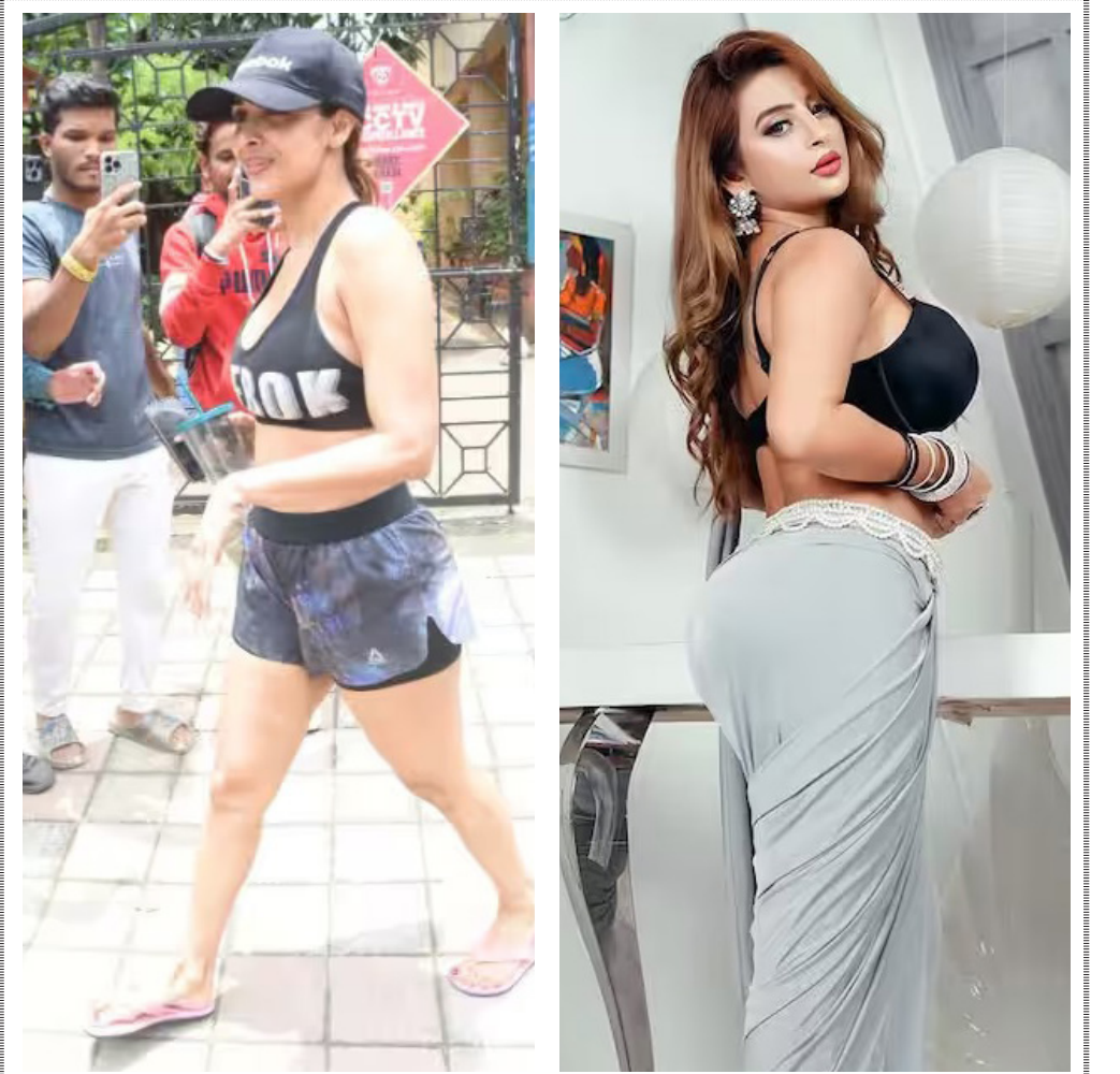
મલાઈકા અરોરા તેના ગ્લેમરસ જિમ લુકને લઈ સતત ચર્ચામાં રહે છે. જિમ લુકમાં મલાઈકા અરોરા ખૂબ જ હોટ લાગે છે. ઈન્સ્ટાગ્રામ પર બોલ સાડી લુકમાં શાનદાર મલાઈકાનો ગ્લેમરસ જિમ લુક ફરી એક વખત તસવીરો શેર કરી છે. આ તસવીરોમાં અંકિતા દવે વાયરલ થઈ રહ્યો છે. મલાઈકા અરોરાએ શાનદાર સાડી લુકમાં જોવા મળી રહી છે. બ્લેક પાપારાઝીને અલગ અંદાજમાં શાનદાર પોઝ આપ્યા છે. અંકિતા દવે તેની હોટ તસવીરો પોસ્ટ કરવાને લુકને લઈ સતત ચર્ચામાં રહે છે. જિમ લુકમાં મલાઈકા અરોરા ખૂબ જ હોટ લાગે છે. ઈન્સ્ટાગ્રામ પર બોલ સાડી લુકમાં શાનદાર મલાઈકાનો ગ્લેમરસ જિમ લુક ફરી એક વખત તસવીરો શેર કરી છે. આ તસવીરોમાં અંકિતા દવે વાયરલ થઈ રહ્યો છે. મલાઈકા અરોરાએ શાનદાર સાડી લુકમાં જોવા મળી રહી છે. બ્લેક પાપારાઝીને અલગ અંદાજમાં શાનદાર પોઝ આપ્યા છે.

બાળકોના મૃતદેહોથી ભરીશું. પરંતુ અમે તેને ક્યારેય પુલ કરી શકીશું નહીં. પ્રેમ દ્વારા જ સેતુ બાંધી શકાય છે. તેણે વધુમાં કહ્યું કે તેની ફિલ્મના શૂટિંગના માત્ર ૩ મહિના પહેલા જ રોકી દેવામાં આવી હતી. ગુસ્સામાં, તેણે ફિલ્મ માટે તમામ સ્ક્રિપ્ટ સામગ્રી એકત્રિત કરી, કલાકારોના લુક ટેસ્ટ લીધા અને તેમને આગ લગાવી દીધી. થોડા સમય પહેલા અભિષેક બચ્ચને પણ ગલાદા પહસને આપેલા ઈન્ટરવ્યુમાં આ ફિલ્મનો ઉલ્લેખ કર્યો હતો. અભિષેકે કહ્યું હતું કે કોઈ ડાયરેક્ટર તેને લોન્ચ કરવા તૈયાર નથી અને બધા કહેતા હતા કે 'તને લોન્ચ કરવાની જવાબદારી અમે લઈ શકીએ નહીં.' આવી સ્થિતિમાં રાકેશ આ સ્ક્રિપ્ટ લખી છે. અભિષેકે કહ્યું હતું કે, 'જ્યારે સ્ક્રિપ્ટ તૈયાર હતી, અમે તેને પિચ કરવા માટે પિતા પાસે લઈ ગયા... અમે આખી સ્ક્રિપ્ટ સંભાળી અને પછી મૌન છવાઈ ગયું. મારા પિતાએ અમારી તરફ જોયું અને કહ્યું, 'બાળકો, આ બકવાસ સ્ક્રિપ્ટ છે, બહાર નીકળો.' આખરે અભિષેકે જે.પી. તેણે દ્વારની 'રેફ્યુજી'થી ડેબ્યૂ કર્યું હતું અને રાકેશ સાથે 'દિલ્લી દ'માં કામ કર્યું હતું.